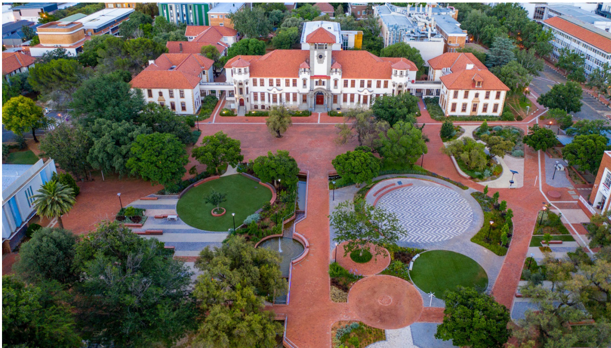
Figuur 1: Die Rooiplein voor die hoofgebou van die Universiteit van die Vrystaat

Teen die agtergrond van transformasie en met behulp van 'n gewetensruimte-benadering ondersoek ek die gedagte dat die universiteit bedink kan word as 'n ruimte met 'n gewete, wat herinnering en etiese verantwoordbaarheid weerspieël. Ek fokus op die UVS en spesifiek die ruimte wat bekend staan as die Rooiplein, waar die standbeelde van M. T. Steyn (die sesde en laaste president van die voormalige Republiek van die Oranje Vrystaat) vanaf die oprigting daarvan in 1929 tot so onlangs soos Junie 2020, en dié van C. R. Swart (apartheid-president, 1961–1967) vanaf oprigting in 1991 tot en met 2016, gestaan het. Die amptelike naam van die plein is Presidentsplein, maar dit het nooit posgevat nie: die plein staan bekend as die Rooiplein (of Rooi Plein), waarskynlik te wyte aan die rooi bakstene waarmee dit gebou is (Universiteit van die Vrystaat 196). Beide die standbeelde van Steyn en Swart staan in die teken van 'n sekere nasionalistiese ingesteldheid en is opgerig met die oogmerk om 'n spesifieke geskiedenis en herinnering te eer, tot uitsluiting van ander.